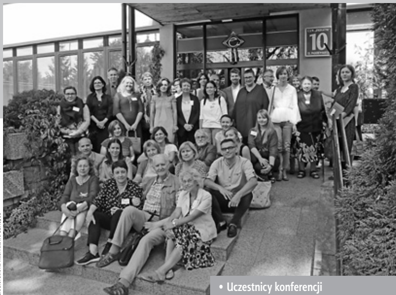
• Uczestnicy konferencji

Znaczna grupa uczestników konferencji to naukowcy od lat współpracujący z lubelskimi etnolingwistami. W tym roku grono badaczy w ramach projektu EUROJOS poszerzyło się o kolejne osoby (m.in. prof. Ga-