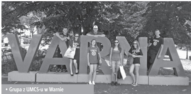
• Grupa z UMCS-u w Warnie