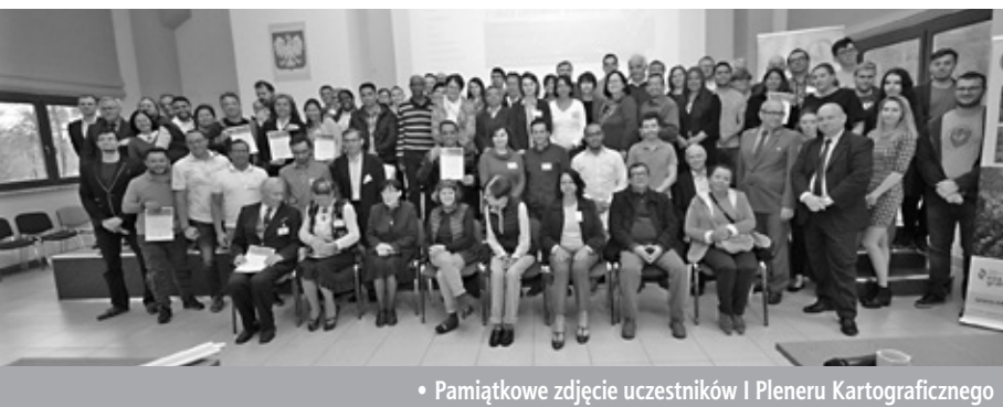
• Pamiątkowe zdjęcie uczestników I Pleneru Kartograficznego

W dn. 16–19 października 2018 r. odbył się I Międzynarodowy Plener Kartograficzny poświęcony tematyce określonej tytule – „Treść, formy i funkcje map tematycznych w erze systemów informacji geograficznej”.