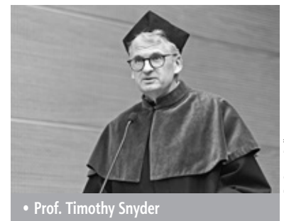
• Prof. Timothy Snyder

Osiemdziesiąty doktor honoris causa UMCS to amerykański historyk, profesor Yale University specjalizujący się we współczesnych dziejach Europy Środkowej i Wschodniej. Tytuł doktora honoris causa został mu przyznany przez Senat UMCS (na wniosek Rady Wydziału Humanistycznego UMCS) za wybitny wkład w rozumienie historii XX stulecia i odwagę głoszenia prawd trudnych, za stałe przypomina-