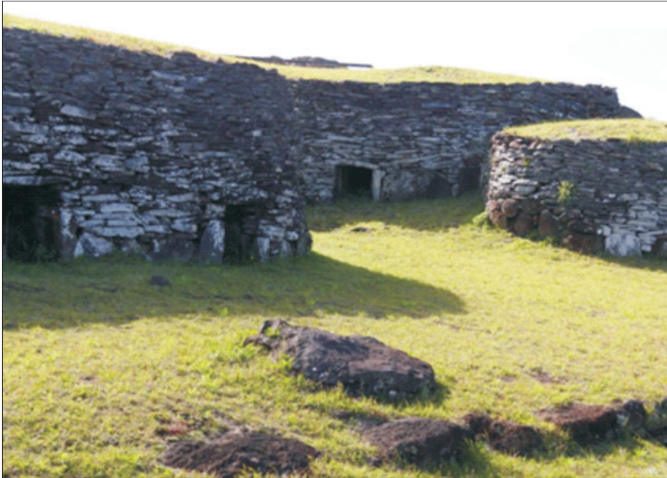
Ryc. 9. Kamienne domy w Orongo

Fig. 9. Stone house in Orongo village