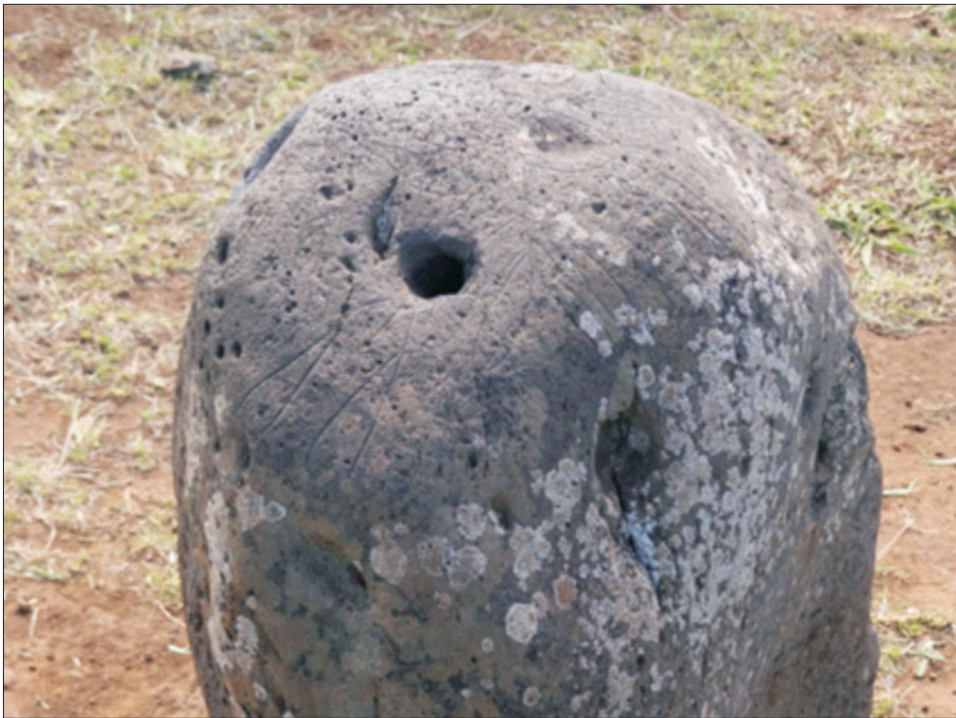
Ryc. 12. Pu Ohiro z wyrytymi na powierzchni symbolami komari . Otwór na pierwszym planie służył do trąbienia

Należy również wspomnieć o petroglifach z północnej części wyspy. Nazywane są one Papa Vaka od największego petroglifu przedstawiającego łódź. Oprócz dwukadłubowej łodzi można znaleźć również morskie zwierzęta takie, jak: rekiny, wieloryby, żółwie, kalmary i ryby, a także dziesiątki haczyków służących do połowu.