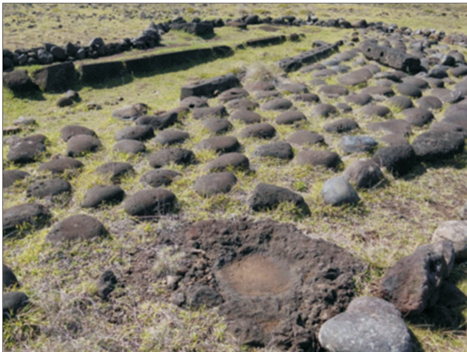
Ryc. 10. Na pierwszym planie zbiornik na deszczówkę, dalej dziedziniec przed domem wykonany z otoczków i podłużne fundamenty domu w kształcie łodzi – hare paenga

Fig. 10. Rainwater reservoir, a courtyard in front of the house made of pebbles and the foundations of a boat-shaped house – hare paenga