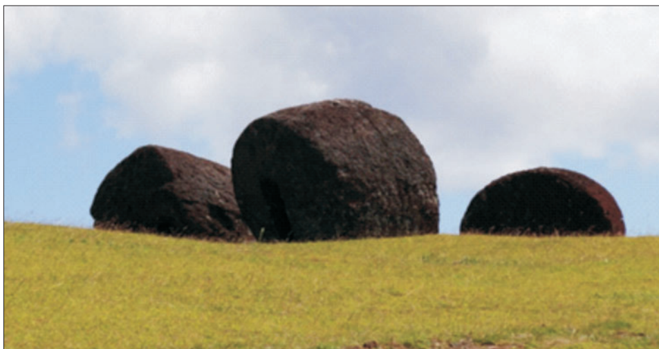
Ryc. 7. Czerwone pukao na zboczach krateru Vaiohao

Pukao (ryc. 7) było przez lata nazywane po hiszpańsku sombrero, czyli kapelusz, jednak nie jest to raczej ten typ nakrycia głowy. Niektórzy interpretują je jako fryzurę typową dla Polinezji, pofarbowaną na czerwono kolorowymi glinkami (co było praktykowane na wyspie), inni jako koronę z czerwonych piór.