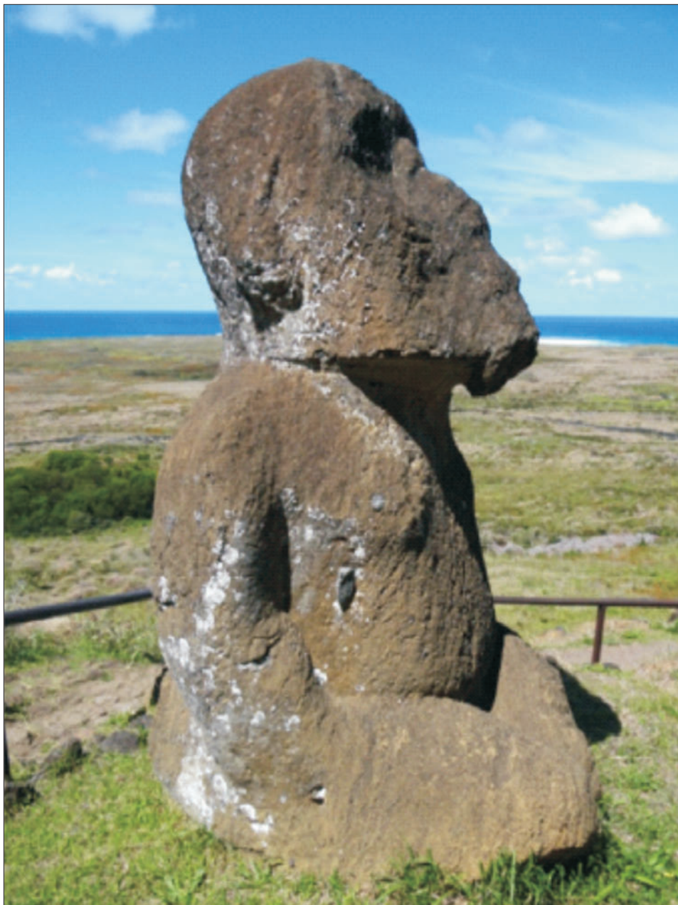
Ryc. 6. Tukturi wykonany z tufu wulkanicznego pochodzącego ze zboczy wulkanu Rano Raraku