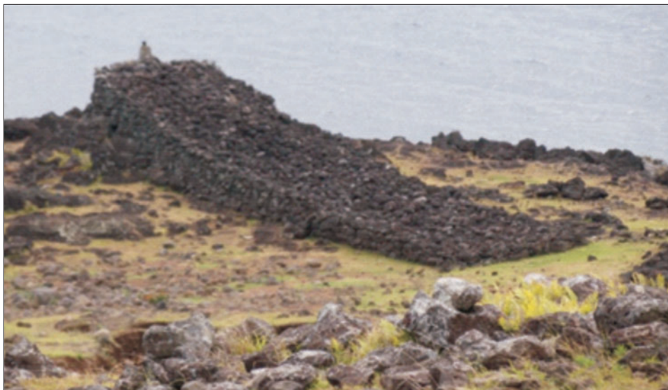
Ryc. 3. Ahu poe poe na zboczach wulkanu Terevaka

Fig. 3. Ahu poe poe on the slope of the Maunga Terevaka