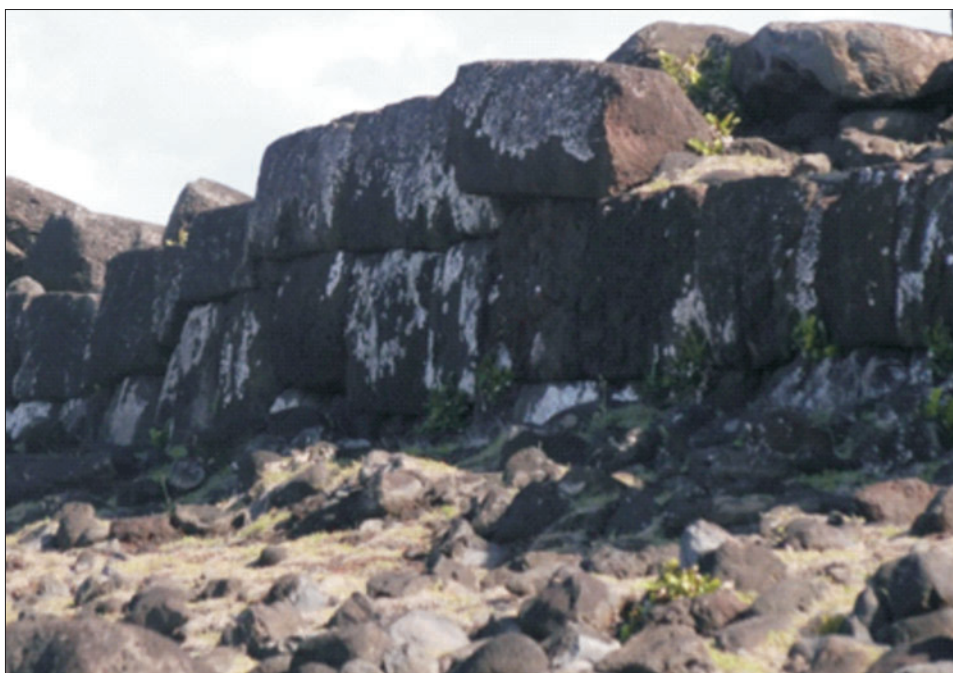
Ryc. 4. Sól oceaniczna wytrącająca się na powierzchni skał tworzących obudowę zewnętrzną Ahu Vaihu

Fig. 3. Ahu poe poe on the slope of the Maunga Terevaka