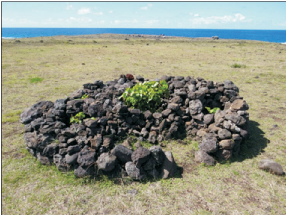
Ryc. 11. Manavai – miejsce wody