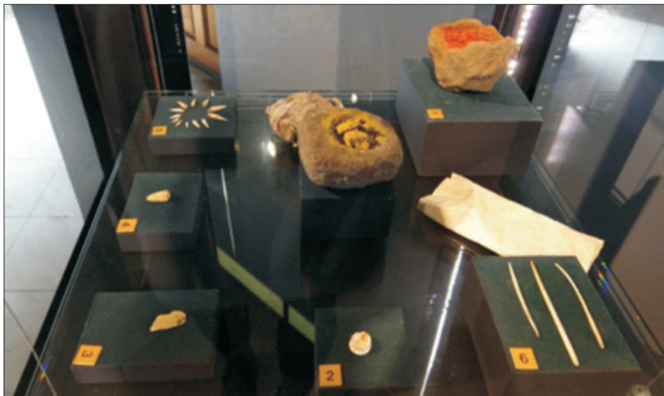
Ryc. 13. Zestaw do wykonywania tatuażu. (Muzeum Sebastiana Englerta, Hanga Roa, Wyspa Wielkanocna)

Fig. 13. Equipment for tattooing. (El Museo Antropologico Padre Sebastian Englert, Hanga Roa, Easter Island)