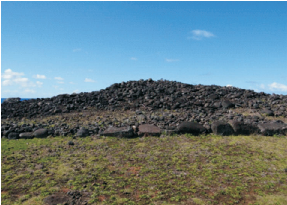
Ryc. 2. Ahu zbudowane z niewielkich otoczków bazaltowych. Tak dzisiaj wygląda większość platform ceremonialnych na wyspie

Po 1722 roku pojawiły się również inne platformy, tak zwane ahu poe poe (ryc. 3), które zaczęto budować dopiero po pierwszej wizycie Europejczyków