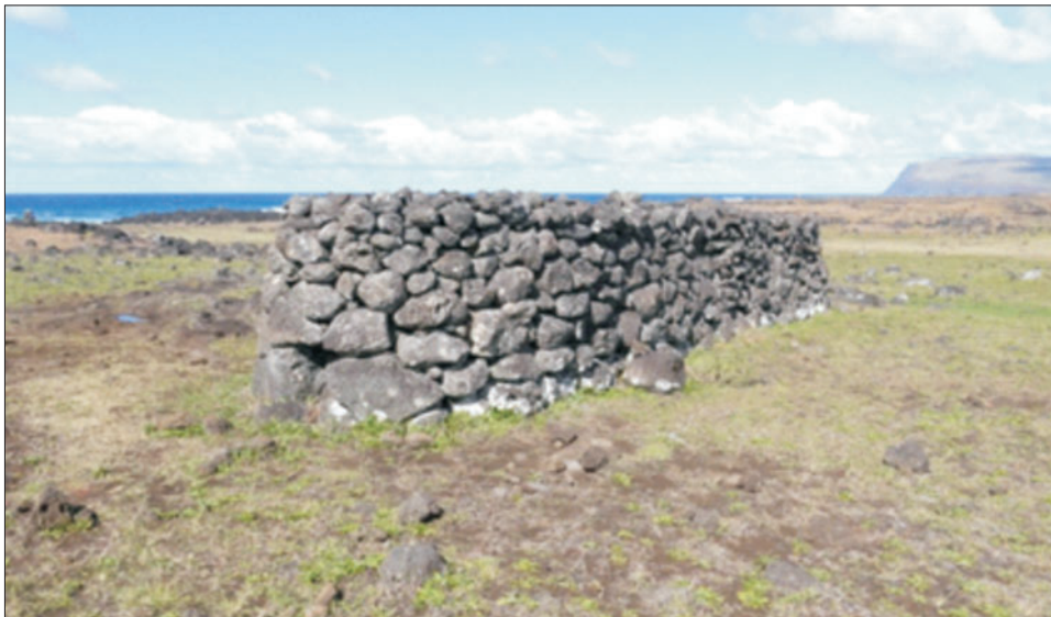
Ryc. 8. Hare moa

Istnieją również dwie teorie tłumaczące zarówno obecność kości ludzkich, jak i kurzych. Pierwsza mówi, że początkowo były to grobowce, a w ciężkich czasach, gdy w czasie głodu liczba drobiu zmalała, zaczęto wykorzystywać je jako pancerne kurniki chroniące resztki hodowli. Druga teoria zakłada, że od początku były to kurniki, a znalezione w środku czaszki zostały przyniesione przez hodowców, by przynosiły szczęście i powodowały szybkie rozmnażanie kur. Zgodnie z miejscowymi podaniami włożenie do kurnika czaszki dawnego wodza lub czaszki ludzi z królewskiego klanu Miru, na której były wyryte