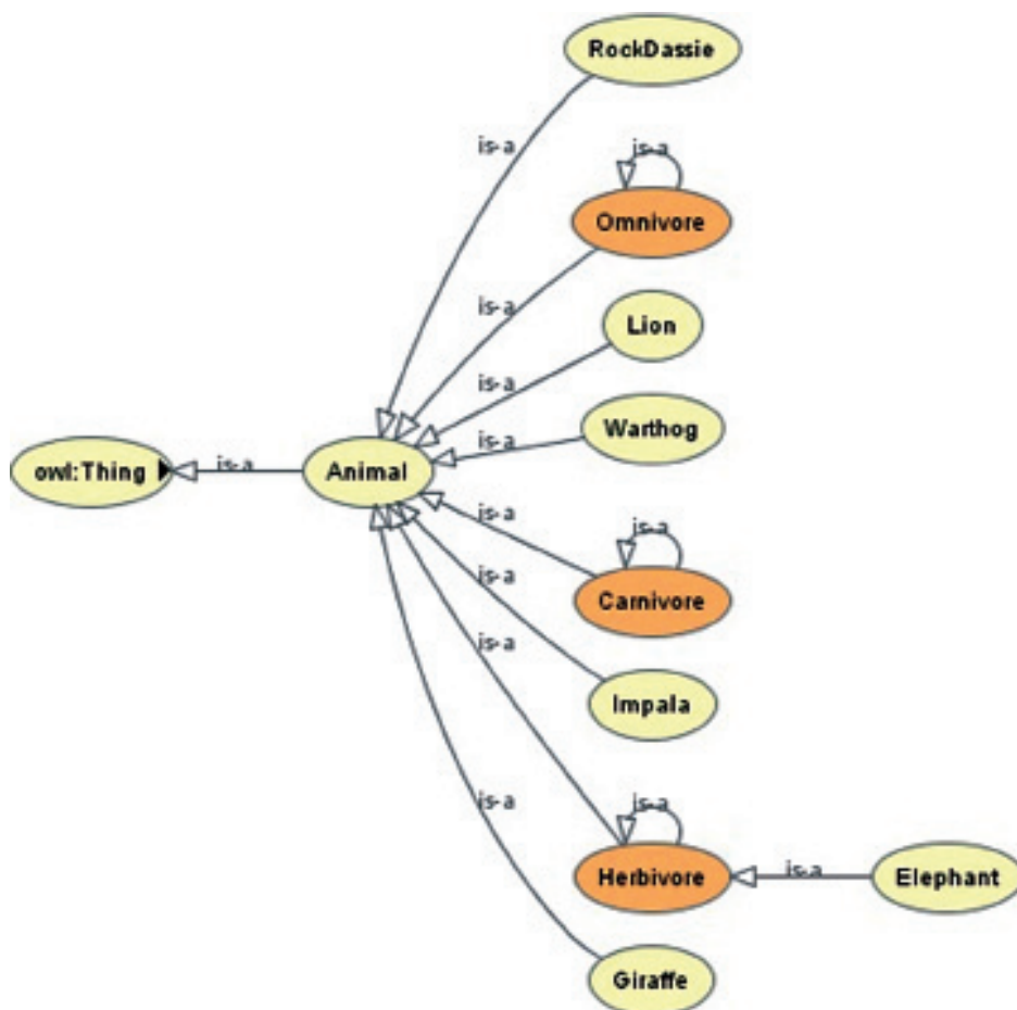
Ryc. 1. Przykładowy graf sieci semantycznej (opracowanie własne) Fig. 1. The graph of semantic network – an example (own elaboration)

ski i in., 2015). Pierwsze praktyczne zastosowania w informatyce wywodzą się ze sztucznej inteligencji; zostały tam użyte w celu ułatwienia współdzielenia i ponownego wykorzystania zgromadzonej wiedzy (Grzelak 2013).