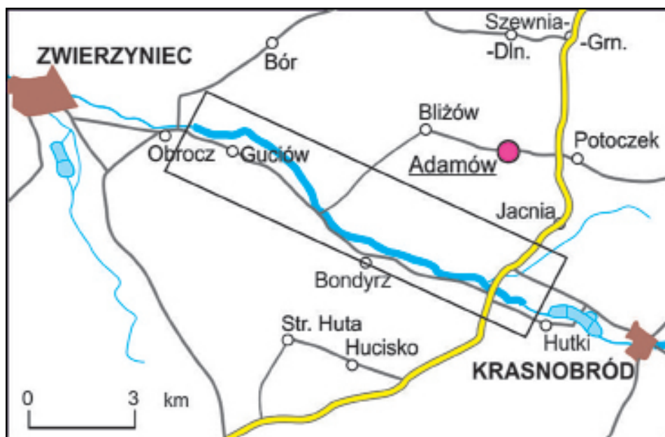
Ryc 2. Analizowany odcinek Górnego Wieprza (Opracowanie własne)

Wybrany dla próby zdefiniowania ontologii zasobów turystycznych szlak kajakowy Wieprza charakteryzuje nizinny i urozmaicony przebieg. Zaadoptowany na potrzeby pracy fragment szlaku (ryc. 2) obejmuje odcinek pomiędzy Hutkami a Guciowem.