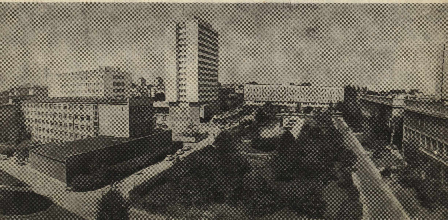
Widok na nowe budynki w dzielnicy uniwersyteckiej