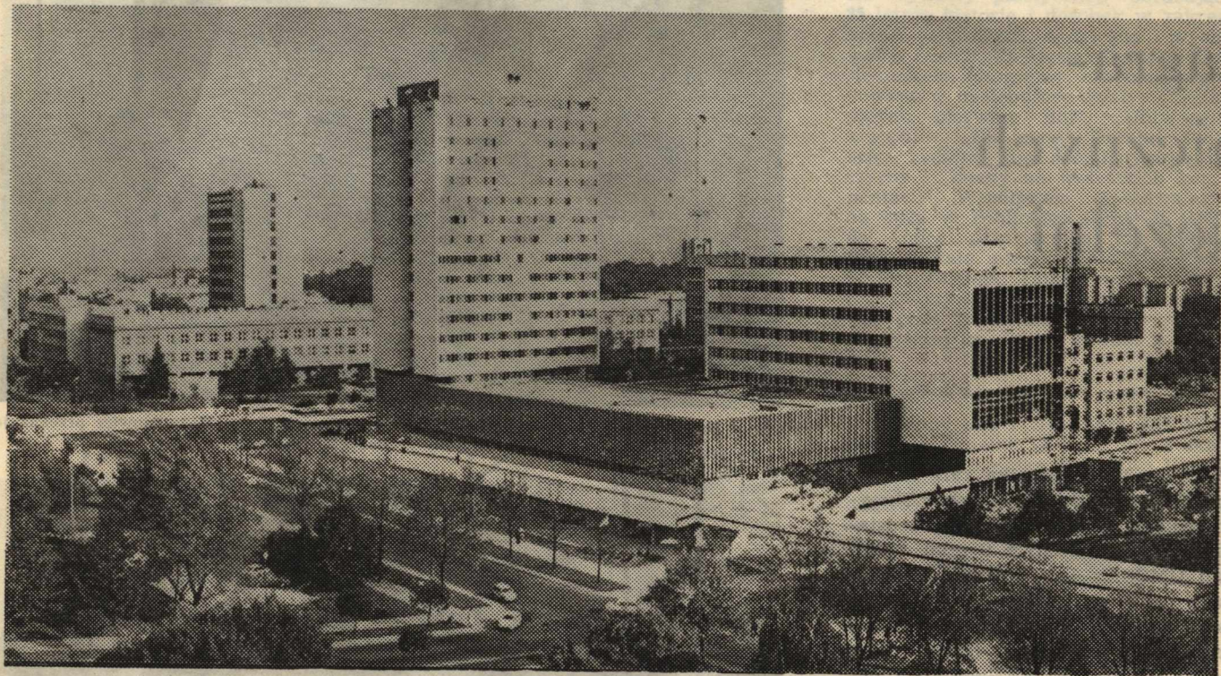
Budynek Wydziału Ekonomicznego i Rektoratu przy Placu Marii Curie-Skłodowskiej 5

W 36 roku akademickim Uniwersytet wzbogacił swoją bazę lokalową. Cierpiący dotychczas na brak sal, auli, pracowni dydaktycznych i ćwiczeniowych, Wydział Ekonomiczny otrzymał własną siedzibę przy placu Patronki Uczelni. Przerobiony hall, duże aule, sale ćwiczeniowe, gabinety zapewniły bardzo dobre warunki pracy zarówno studentom, jak i pracownikom naukowym.