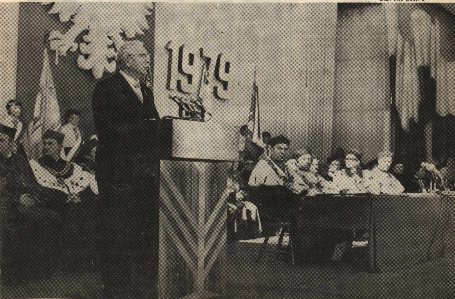
Zadania nauki i szkolnictwa wyższego omówił w swoim przemówieniu podczas Centralnej Inauguracji Roku Akademickiego 1979/80 I Sekretarz KC PZPR tow. Edward Gierek