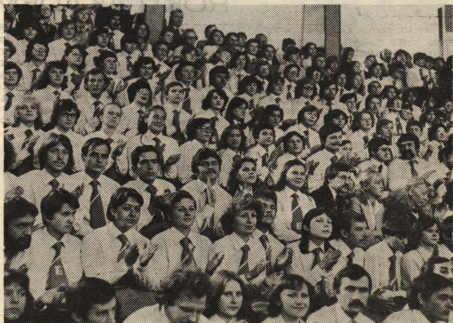
Młodzież akademicka UMCS podczas Centralnej Inauguracji Roku Akademickiego 1979/80