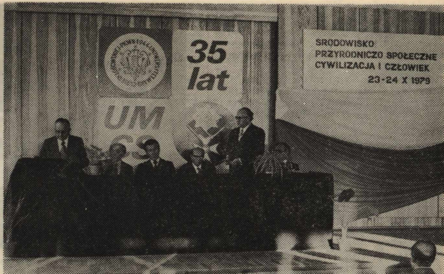
Obrazy środowiskowej sesji naukowej. Środowisko przyrodniczo-społeczne. Cywilizacja i człowiek

Fundamentalne jednak znaczenie ma — ze względu na jego zakres — wydane w roku 1969 (II wydanie — rok 1970) dzieło pt. „Prawo zobowiązań w zarysie”. Choć formalnie było ono pomyślane jako podręcznik, to