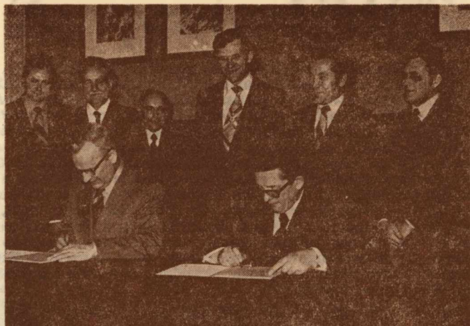
Podpisanie umowy o współpracy między Ministerstwem Sprawiedliwości a UMCS

Planowane jest powoływanie wspólnych zespołów naukowych do rozwiązywania poszczególnych zagadnień, organizowanie konferencji i szkoleń z udziałem przedstawicieli UMCS i OZZK w Lublinie. W umowie znalazły także miejsce postanowienia o zapewnieniu stypendiów fundowanych studentom psychologii, o pomocy materialnej w organizowaniu obóz naukowych, stażów i praktyk naukowych. Wprowadzo-