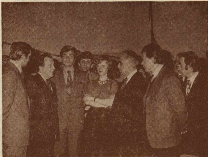
Goście bułgarscy w rozmowie z kierownictwem Uczelni