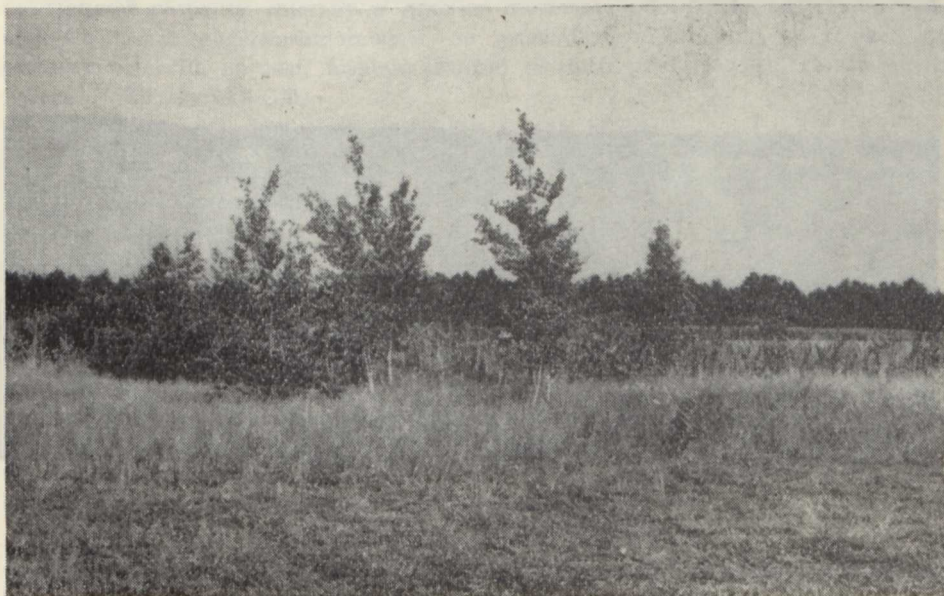
Ryc. 2. Torfowisko nad jeziorem Gorbacz Peatbog near the Gorbacz lake

Woźna Wieś na E od Grajewa, w lesie olchowym z domieszką świerka; Czerwone Bagno k. Woźnej Wsi, w borze bagiennym na kępach u podstawy drzew; Osowiec, na stale podtopionych łąkach; jez. Maliszewo w kompleksie bagien Wizna, w Alnetum ; jez. Gorbacz k. Michałowa, las olchowy nad jeziorem (ryc. 2).