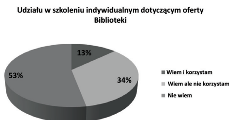
Ryc. 2. Znajomość oferty szkoleniowej dla indywidualnych czytelników.

Analizując kolejne pytanie, zauważono, że duży odsetek (53%) ankietowanych nie zdaje sobie sprawy z możliwości uczestniczenia w szkoleniu indywidualnym dotyczącym oferty biblioteki. Taki wynik wskazuje na potrzebę ciągłego informowania oraz wprowadzenia nowych sposobów na docieranie do użytkowników. Zastanawiające jest także to, że jedynie 13% badanych korzystało z indywidualnego przeszkolenia, co sugeruje konieczność większego otwarcia się bibliotekarzy na przychodzącego czytelnika (ryc. 2).