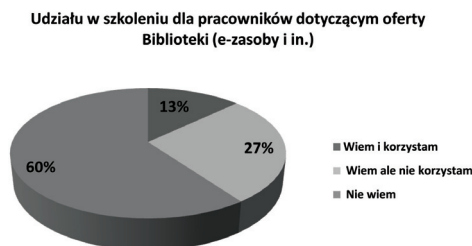
Ryc. 3. Znajomość oferty szkoleniowej dla pracowników.

Oferta Biblioteki Głównej UP w zakresie prowadzenia szkoleń dla pracowników uczelni jest znana mniej niż połowie ankietowanych (40%). Jednak z całej grupy badanych aż 158 zaznaczyło, że nie korzysta z tej oferty szkoleń (ryc. 3). Zachowanie to można tłumaczyć nieznaną ofertą biblioteki bądź własnymi umiejętnościami informacyjnymi użytkowników bibliotek uniwersyteckich. Użytkownicy sprawnie posługujący się informacjami w sieci mogą nie być zainteresowani tą usługą biblioteki. Jednak jak wynika z doświadczenia pracy z użytkownikiem poszukującym informacji naukowej, brak zainteresowania zdobywaniem szerszych umiejętności korzystania z zasobów biblioteki wpływa na wykorzystanie zaledwie ich części.