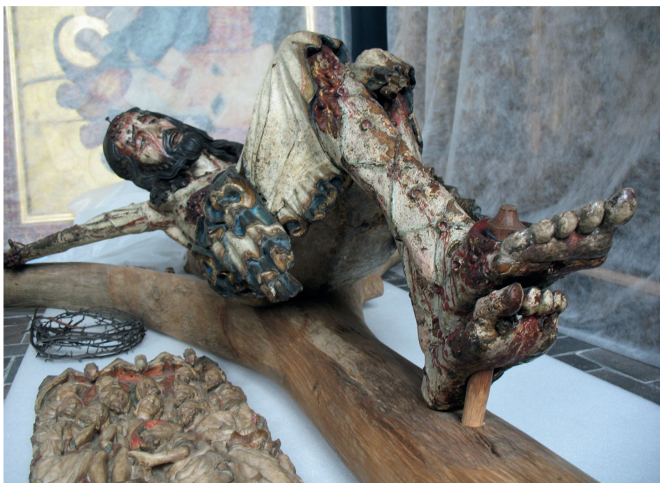
Ilustracja 5. Krucyfiks z kościoła Bożego Ciała we Wrocławiu, Ekspozycja Galerii Sztuki Średniowiecznej w Muzeum Narodowym w Warszawie.