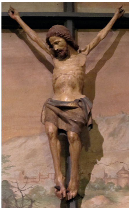
Ilustracja 14. Krucyfiks z kościoła św. Andrzeja w Pistoii.