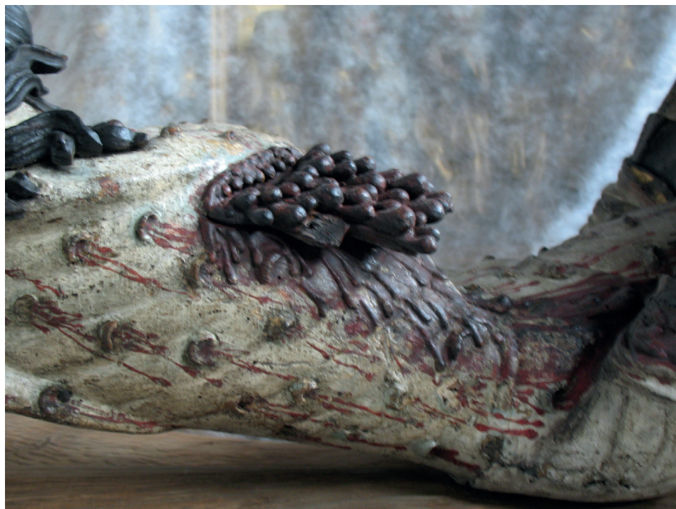
Ilustracja 7. Krucyfiks z kościoła Bożego Ciała we Wrocławiu, Ekspozycja Galerii Sztuki Średniowiecznej w Muzeum Narodowym w Warszawie.