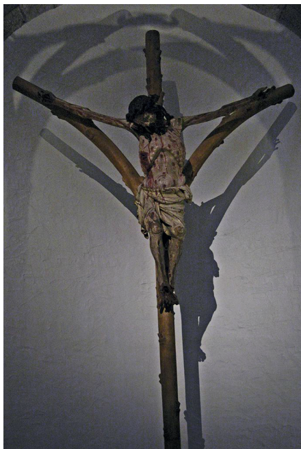
Ilustracja 8. Krucyfiks z kościoła św. Jerzego w Kolonii.