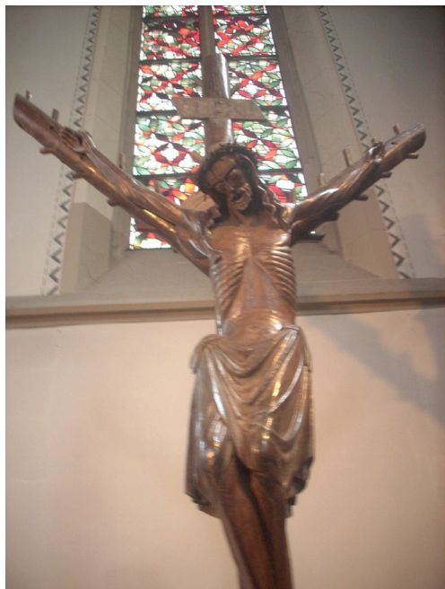
Ilustracja 12. Krucyfiks z kościoła św. Sykstusa w Haltern.