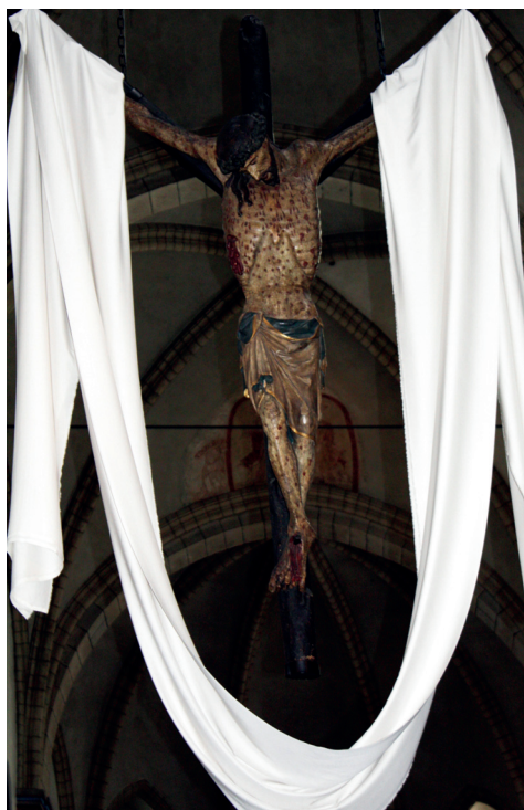
Ilustracja 16. Krucyfiks z kościoła św. Seweryna w Kolonii.