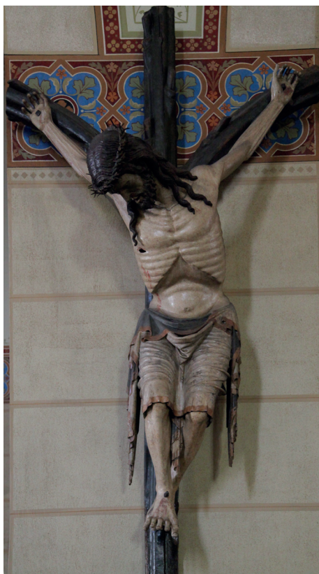
Ilustracja 10. Krucyfiks z kościoła Dominikanów w Friesach.