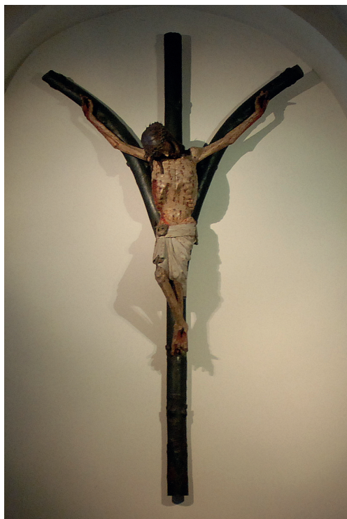
Ilustracja 11. Krucyfiks z kościoła Najświętszej Marii Panny na Kapitulu w Kolonii.