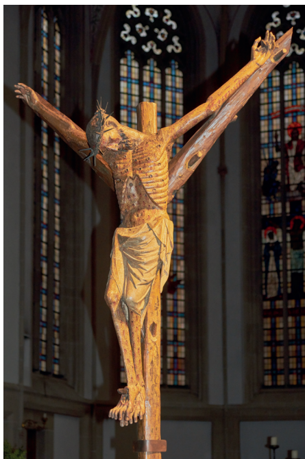
Ilustracja 17. Krucyfiks z kościoła św. Jerzego w Bocholt.