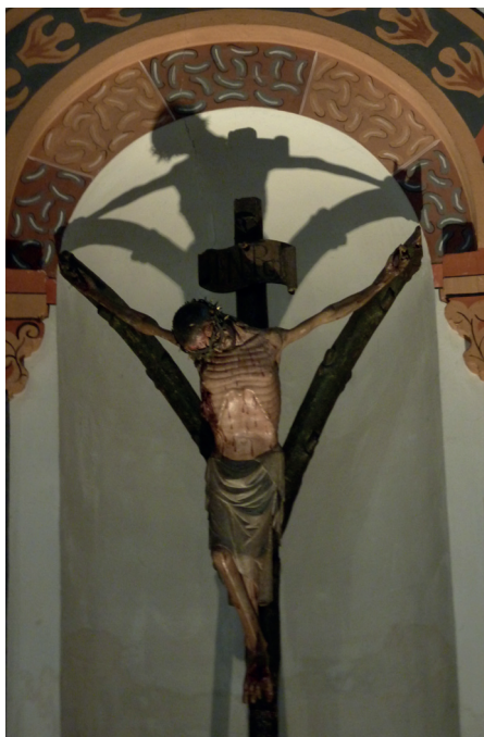
Ilustracja 13. Krucyfiks z kościoła Najświętszej Marii Panny w Andernach.