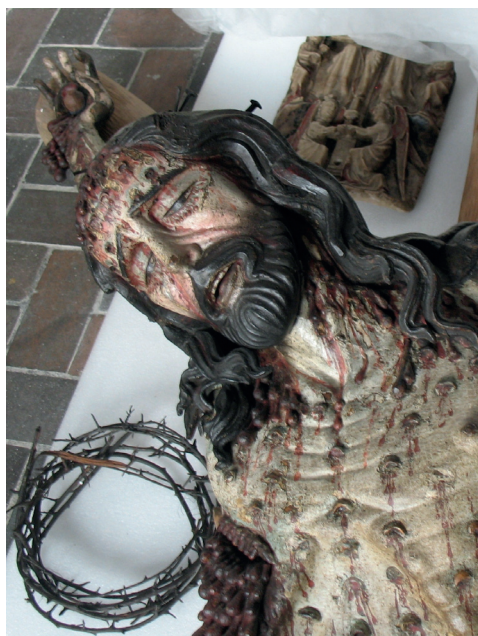
Ilustracja 4. Krucyfik z kościoła Bożego Ciała we Wrocławiu, Ekspozycja Galerii Sztuki Średniowiecznej w Muzeum Narodowym w Warszawie.