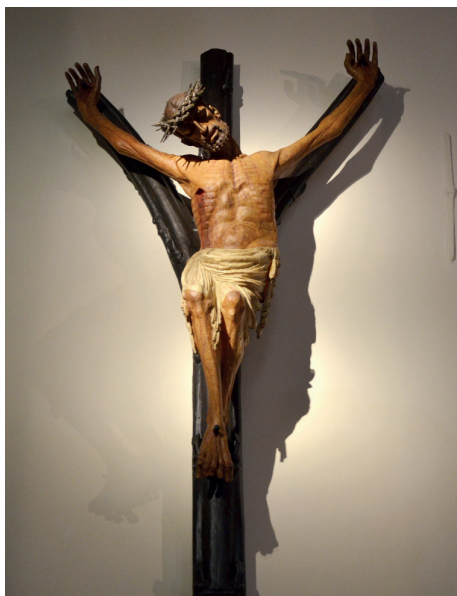
Ilustracja 9. Krucyfiks z kościoła św. Ignacego w Jihlavie.