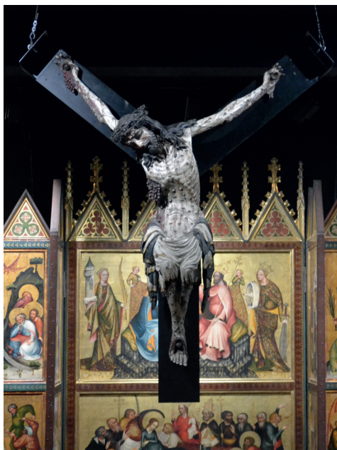
Ilustracja 1. Krucyfiks z kościoła Bożego Ciała we Wrocławiu, Ekspozycja Galerii Sztuki Średniowiecznej w Muzeum Narodowym w Warszawie.