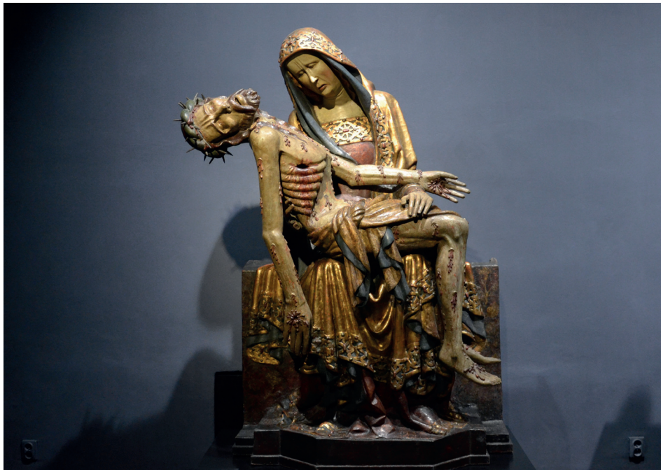
Ilustracja 18. Pieta z Lubiąży, Ekspozycja Galerii Sztuki Średniowiecznej w Muzeum Narodowym w Warszawie.