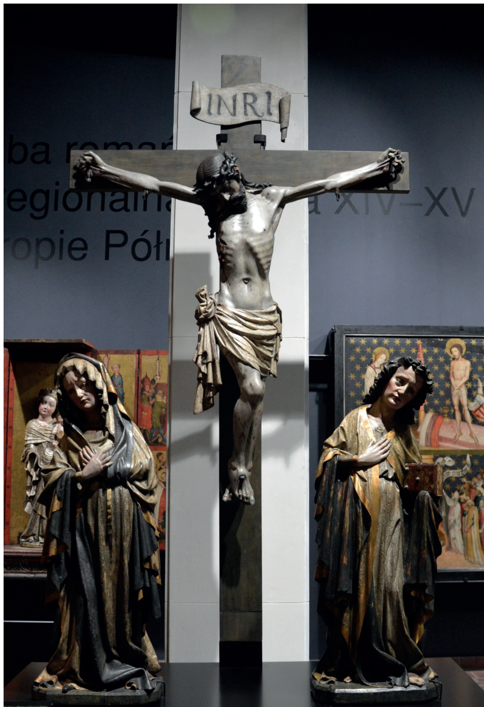
Ilustracja 19. Grupa Ukrzyżowania z kaplicy Dumlosych, Ekspozycja Galerii Sztuki Średniowiecznej w Muzeum Narodowym w Warszawie.