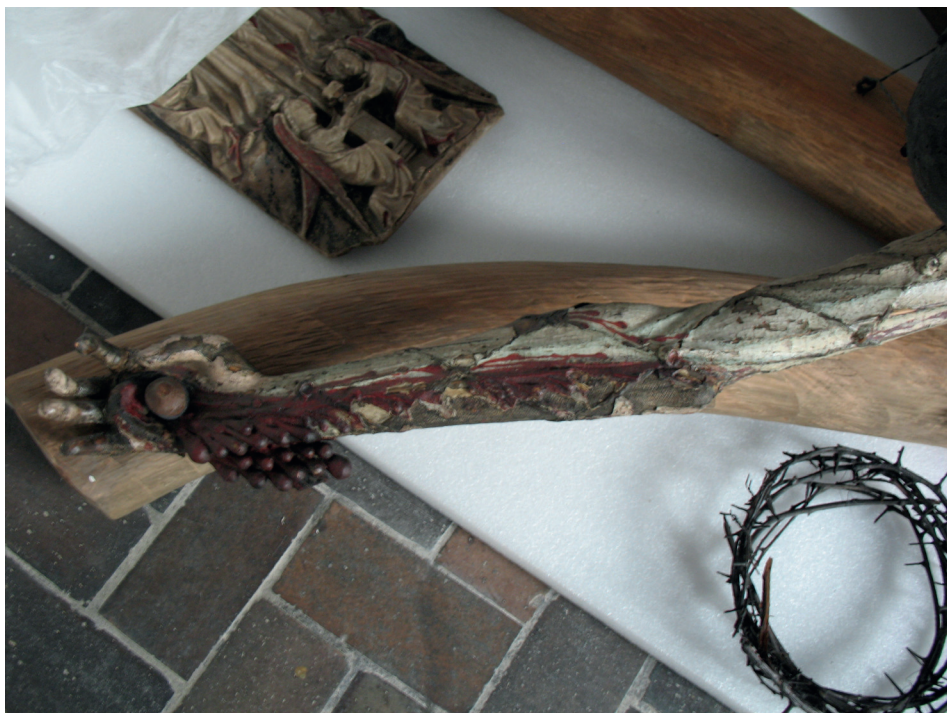
Ilustracja 2. Krucyfiks z kościoła Bożego Ciała we Wrocławiu, Ekspozycja Galerii Sztuki Średniowiecznej w Muzeum Narodowym w Warszawie.