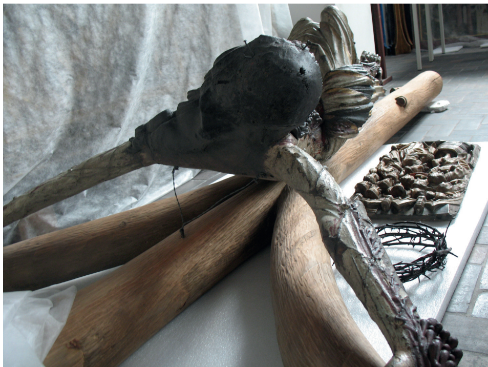
Ilustracja 3. Krucyfik z kościoła Bożego Ciała we Wrocławiu, Ekspozycja Galerii Sztuki Średniowiecznej w Muzeum Narodowym w Warszawie.