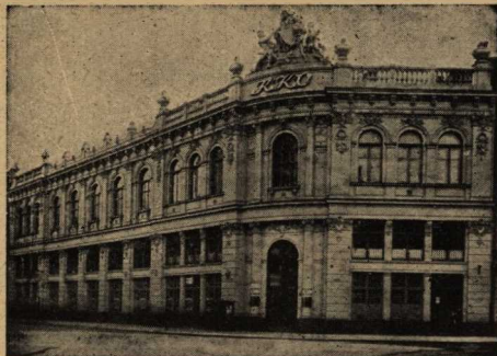
Gmach własny K. K. O. pow. Warszawskiego w Warszawie (ul. Zgoda Nr. 7, róg ul. Złotej).

Z W I A Z K U P O R Ę C Z A J A C E G O (5 miast oraz 26 gmin podstol.)