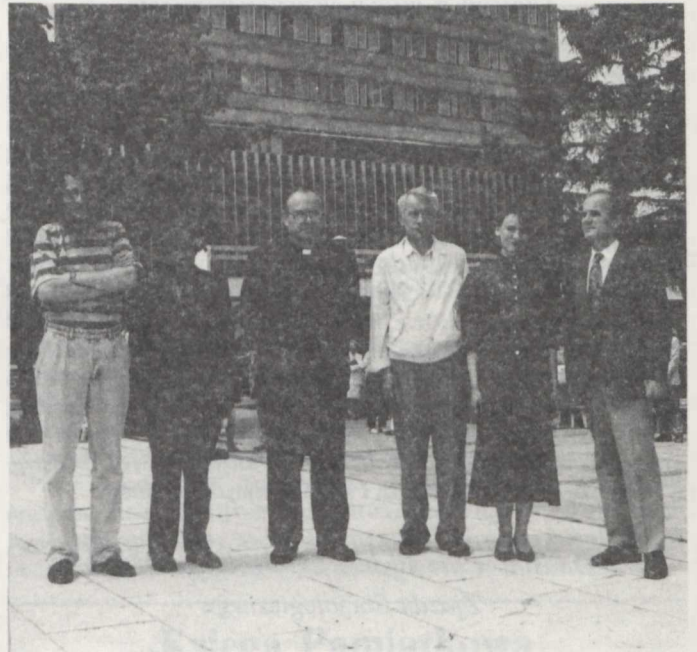
Zarząd Lubelskiego Oddziału PTS