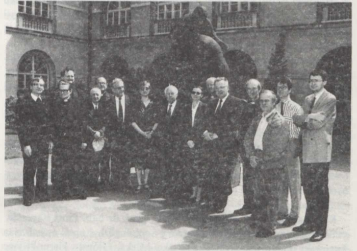
Pracownicy Sekcji Społecznej KUL