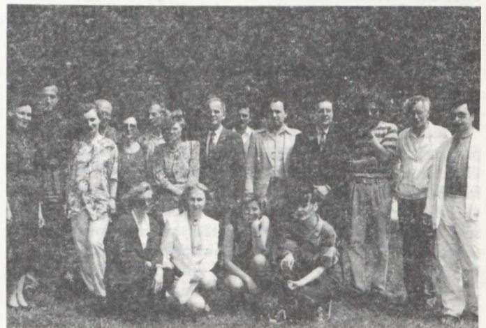
Socjologowie z Wydziału Filozofii i Socjologii UMCS

Po roku funkcjonowania Instytut podzielono na dwa. Jednym z nich był Instytut Filozofii i Socjologii, w którym nadal istniał wymieniony Zakład. W marcu 1973 r. do Instytutu przyłączył się Zakład Nauk Społecznych Akademii Medycznej. Dzięki temu Instytut został jednostką międzyuczelnianą, nadal umiejscowioną w strukturze UMCS. Jednocześnie socjologia wzbogaciła się o pracownika przybyłego z AM.