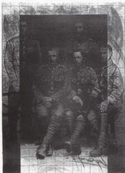
JOCIA PRZYJALNIA ARSLEY 17. LIBERTY 1988

9 MIEDZYNARODOWE BIENNALE GRAFIKI W SEULU 1996 9th INTERNATIONAL PRINT BIENNALE OF SEOUL 1996