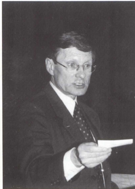
Wykładowi profesora Leszka Balcerowicza towarzyszyło ogromne zainteresowanie; na jego wykład przybyli nie tylko studenci i pracownicy naszej Uczelni, ale też i mieszkańcy Lublina.