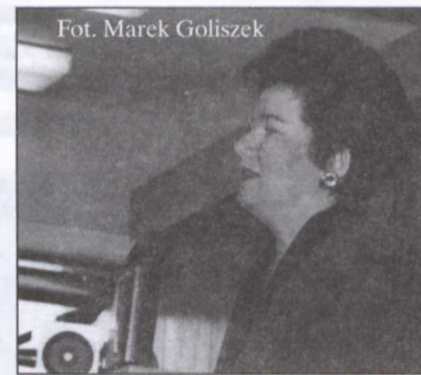
29 lutego 1996 r. Hanna Gronkiewicz-Waltz na Wydziale Ekonomicznym przedstawia wykład nt. Roli banku centralnego.

9 stycznia 1999 roku Hanna Gronkiewicz-Waltz otrzymała nagrodę miesięcznika „Sukces” w uznaniu za wybitną i decydującą rolę w zredukowaniu inflacji – po raz pierwszy od 18 lat – do poziomu jednocyfrowego. 16 stycznia bieżącego roku została uhonorowana Złotą Statuetką Business Centre Club, jako wyraz uznania 1700 najlepszych polskich przedsiębiorców, członków Klubu, dla tych, którzy wnieśli znaczący wkład w budowę i stabilizację ładu gospodarczego w naszym kraju oraz tworzenie