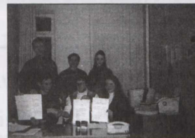
Podpisanie umowy z samorządem studentów z Kijowa.

Właśnie z powodu braku uregulowań prawnych podjęto decyzje o unieważnieniu wyborów na Wydziałach: Pedagogiki i Psychologii, a później Politologii (sprawa w toku).