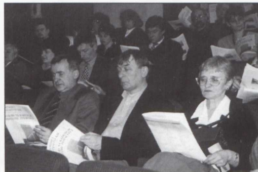
Takim zainteresowaniem cieszył się numer wyborczy naszej gazety.