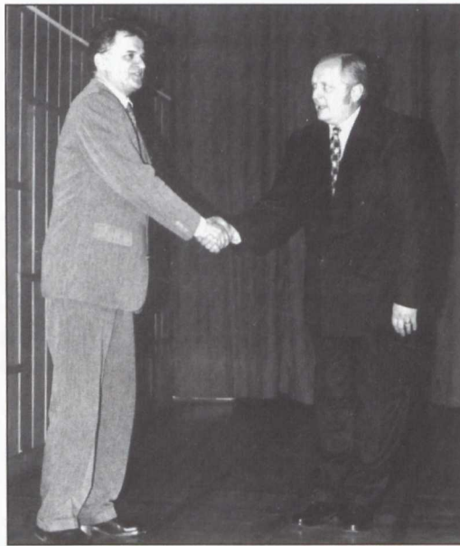
Po spotkaniu obaj kandydaci gratulowali sobie występów i kampanii wyborczej prowadzonej z zachowaniem tradycji i kultury akademickiej.