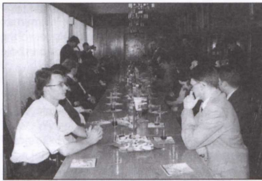
Uroczyste wręczenie dyplomów w Sali Senatu.

Dyplom ukończenia kursu jest wydawany w ję-