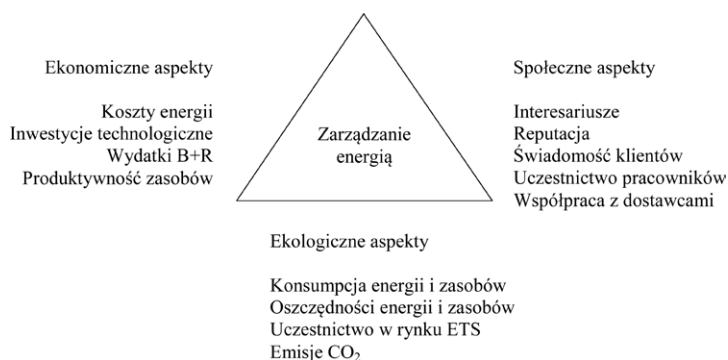
Rys. 1. Aspekty efektywności energetycznej w kontekście rozwoju zrównoważonego