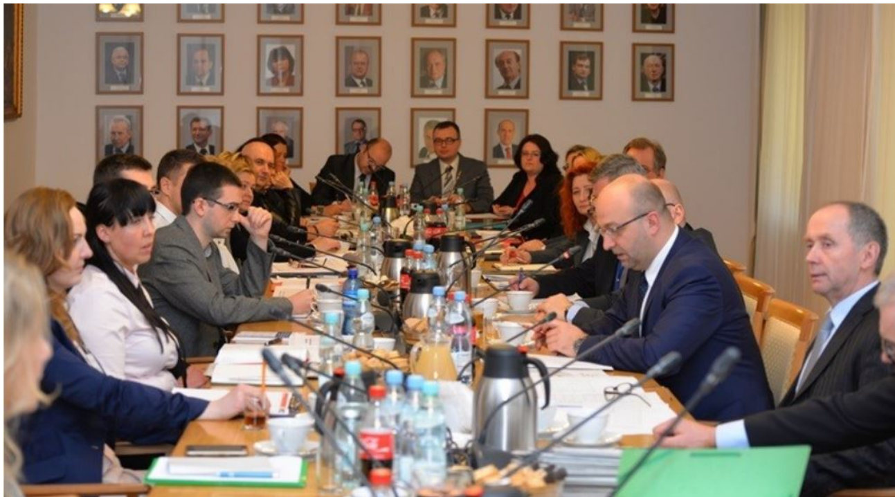
SPOTKANIE W M.S.—16.02.2016 R.—NASI NA PIERWSZYM PLANIE PO LEWEJ