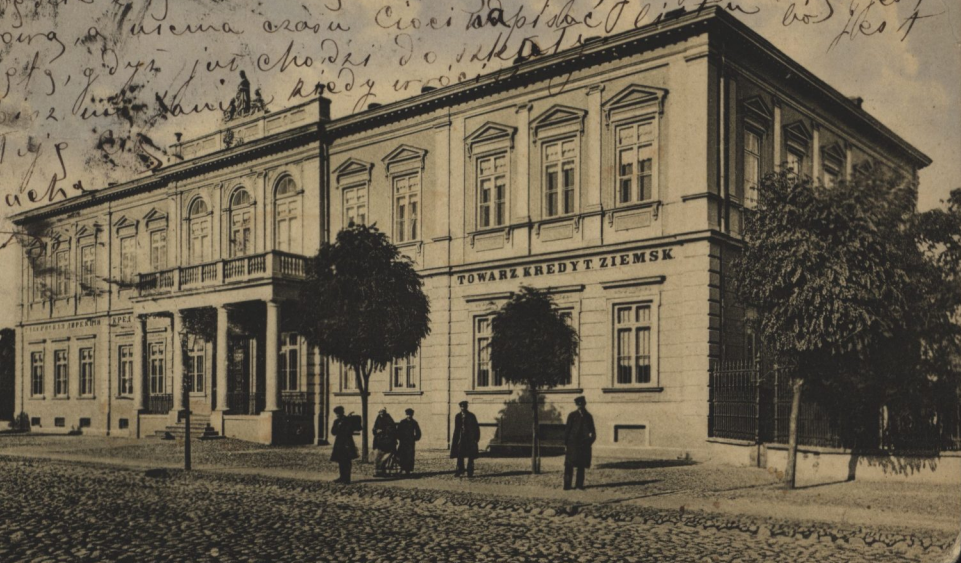
TOWARZ KREDYT ZIEMSK

sy akurat odebratan od Ciebie karty i pretensyj ze ja nie do Ciebie wie Lublin. Towarzystwo Kredyt. Ziemske. kiedy wróciba do Lublina? Ogromnie mi sie to martwi, ze podobno Ci nie jest lepiej or ty bedzie z tyg staradny choroby. Zapytaj sie o to czy jest Lwow, a usama czasu Ciwi napisac listu bo jest Lajety, gdzie jut chodzi do sekretu odpraz. wiez. Lajety kredy w... Caty p... Staeba