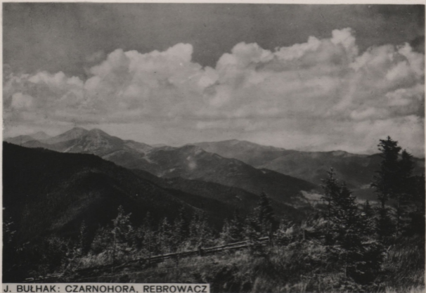
J. BUŁHAK: CZARNOHORA, REBROWACZ