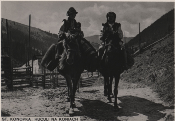
ST. KONOPKA: HUCULI NA KONIACH