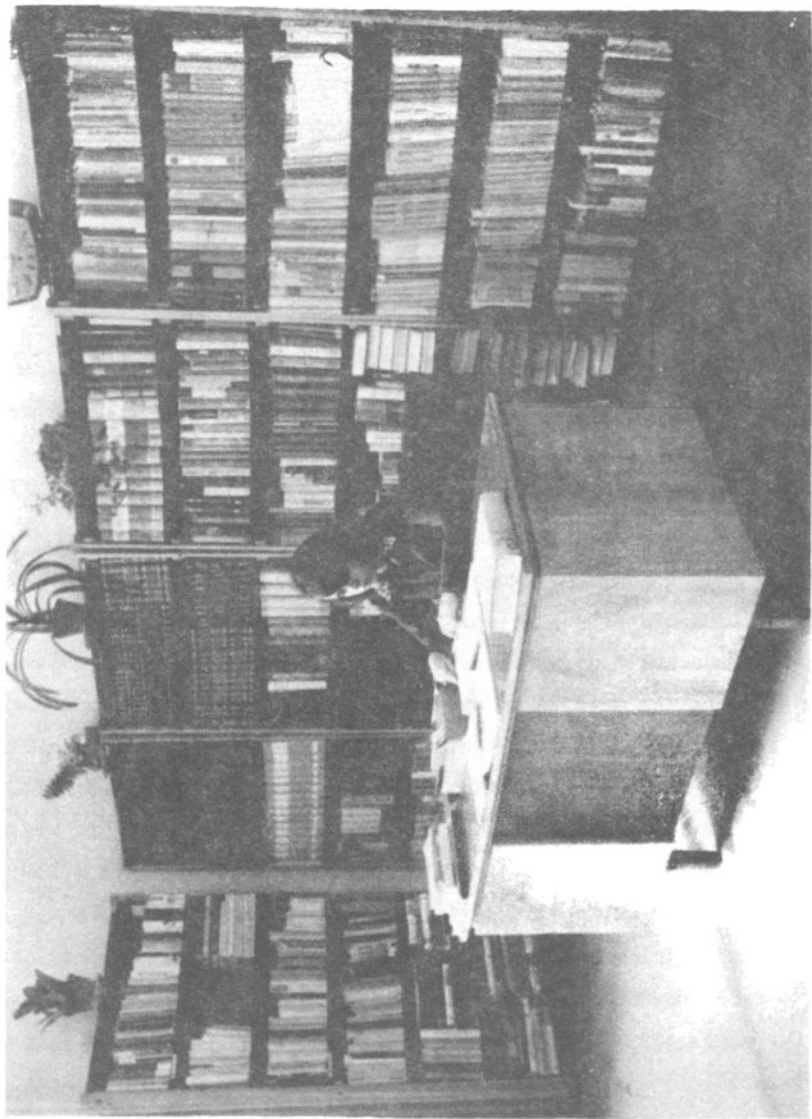
Fragment czytelnicy Biblioteki Wydziału Pedagogiki i Psychologii