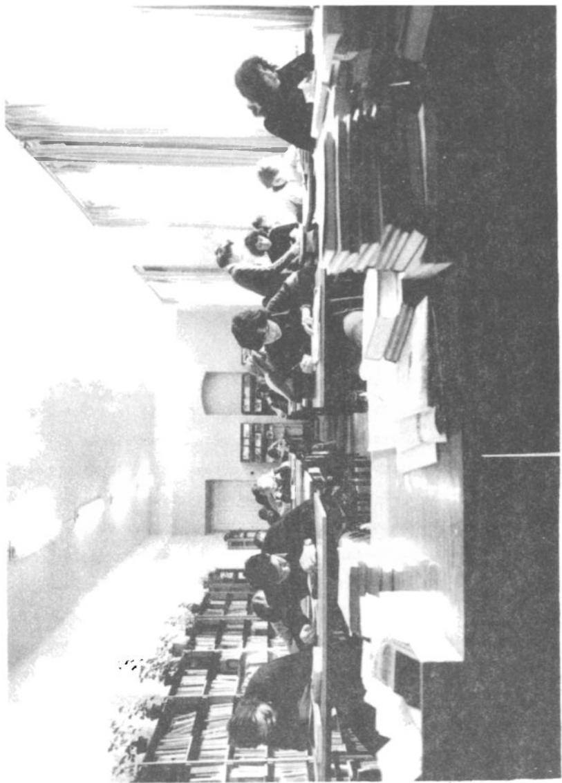
Czytelnia Biblioteki Wydziału Pedagogiki i Psychologii